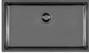
UNIKA 710 GUN METAL N157 F56